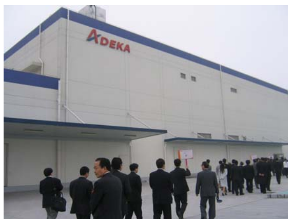
開業式典参列者の工場参観

2008 年の北京オリンピック、2010 年の上海万博という食品業界にとっては追い風となる巨大イベントに乗って、艾迪科食品(常熟)有限公司の中国での事業が順調に発展し、成功をおさめられる事を心より祈念致します。