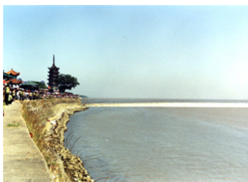
銭塘江の勢いのある逆流

昼食後、私たちは海寧市の中心に立地する省級開発区の海寧経済開発区を訪問しました。 海寧経済開発区 ( www.hnkfq.com ) : 海寧経済開発区は、1992年に設立され、1997年に省級開発区の認定を受けました。海寧市の北部に立地して市街区に近接し、滬杭高速道路(上海