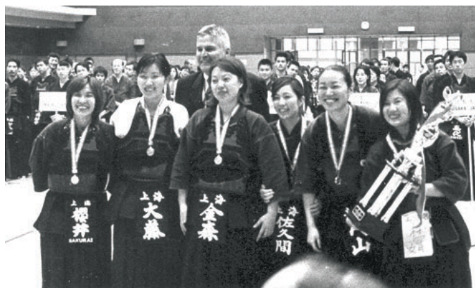
上海女子チーム団体戦優勝

上海剣道愛好会 URL : http://www.shanghai-kendo.com