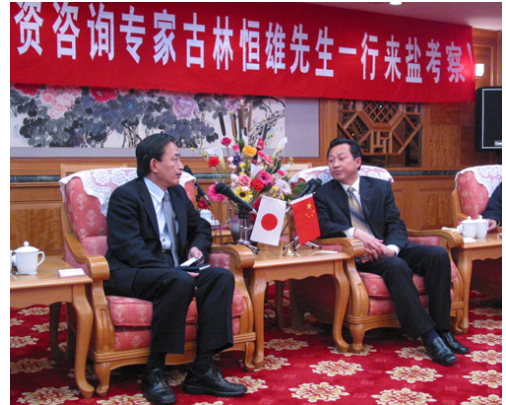
塩城市共産党副書記、市長趙鵬氏(右)と古林総経理の会見

27日夕、視察団一行は塩城市共産党委員会副書記、市長である趙鵬氏をはじめとする市の幹部と会見し、趙市長から同市の概況が紹介されました。塩城市は蘇北平原の中央部に位置しており、582kmにわたる海岸線と太平洋西岸地区では最大の683万畝(約4,549km 2 )に及ぶ干潟を有する、生態環境に恵まれた土地です。塩城の国家級珍鳥類自然保護地区には毎年1,000羽程の丹頂鶴が飛来し、世界の鶴類の50%以上を占めている他、大豊国家級四不象(鹿の一種)自然保護区には世界の総数の25%に当たる600頭余りの四不象が飼育されており、国家AA級のレジャー地区として有名です。一方で経済は急速な発展を続けており、豊富な土地、労働力資源等、数多くの利点がクローズアップされています。アクセス面では、上海直結の高速道路(塩通高速)が建設中で、2005年末完成の暁には、上海まで僅か2時間半(現在は4時間)となります。趙市長は今回の視察を通して塩城をよく見て頂き、日本やその他の外国の方々に塩城を紹介して頂きたいとの希望を話しました。古林総経理は自ら中国語で自社の状況を説明すると共に、今後は日本企業に塩城を推薦し、相互発展を目指しましょうと語りました。