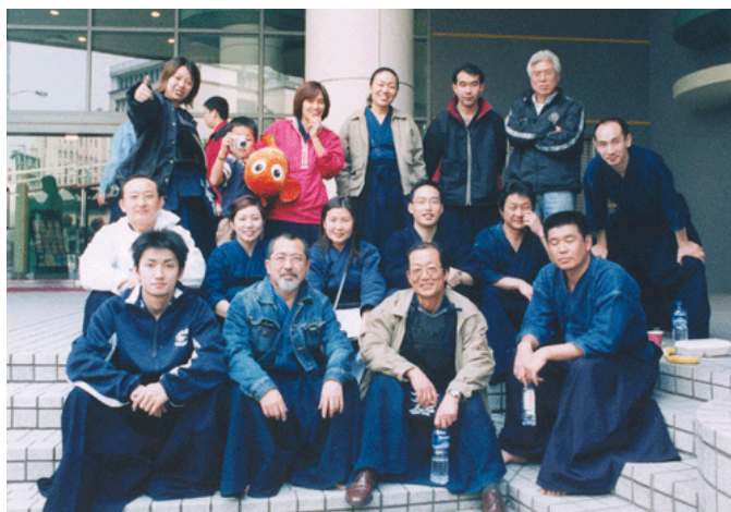
上海剣道愛好会の面々

これまでの上海剣道愛好会は、剣道好きの日本人が集まって稽古をするという「対外不開放」の活動をしていました。しかしSARS騒動中、活動場所として使ってきた上海日本人学校の体育館は「日本人学校の生徒とその関係者以外は使用禁止」となり、「日本人学校使用不可メンバー」である私たち上海剣道愛好会の面々は、上海市内の狭いジムを2週間ずつ転々とするという、渡り鳥さながらの稽古を続ける羽目になったので