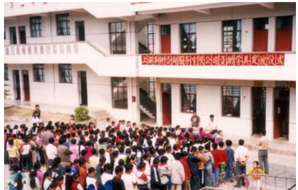
在云南华钟希望小学举行的 SHCS 资助学具发放仪式

为了让更多的会员企业能及时了解最新的“华钟希望工程”的近况，本公司已经开始着手在公司网站上设立专门的“华钟希望工程”网页，并随时将孩子们收到捐赠物品后写给我们的信件以及捐赠仪式上的照片等资料公布在网页上。