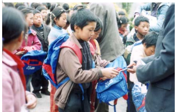
小学生们欣喜地接受这些助学用品